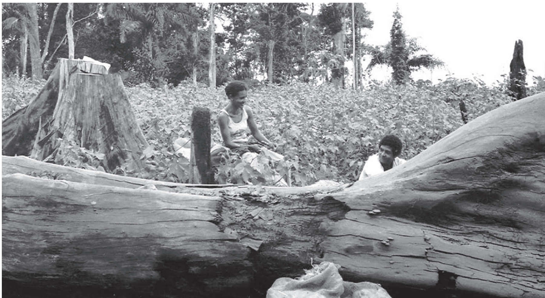
Rondônia, 1976