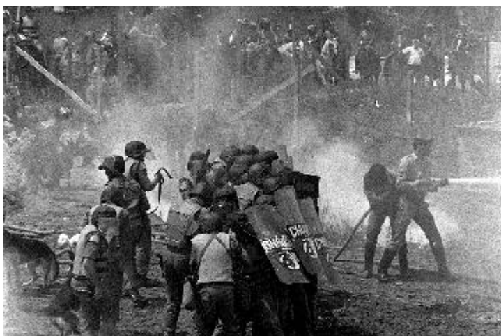
Expulsão de invasores na Vila Socialista, 1990 (Diário do Grande ABC).

Diadema apresenta uma peculiaridade. Foi ao mesmo tempo uma das cidades mais violentas