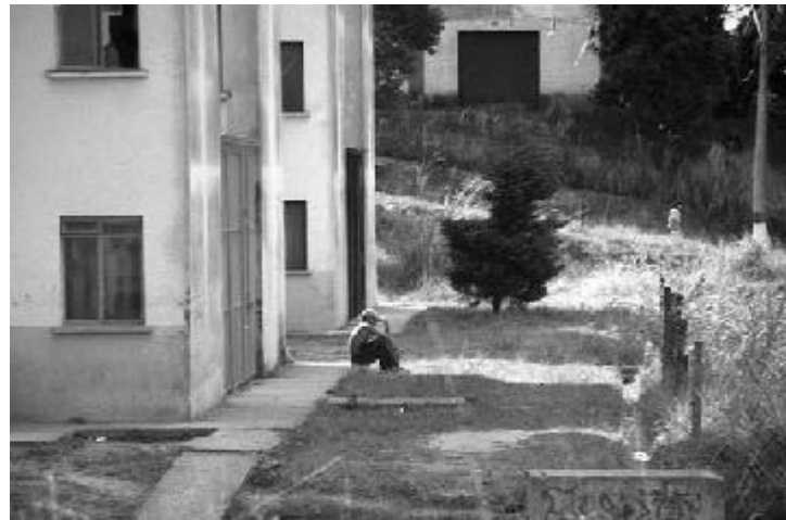
Conjunto habitacional Vila Socialista, 2000.

As lideranças políticas inicialmente incentivavam as invasões. Mas com o tempo