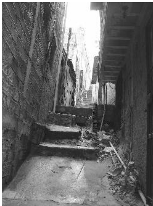
Beco da Favela Pantanal, 2005.

Com essa cultura do fracasso, a educação