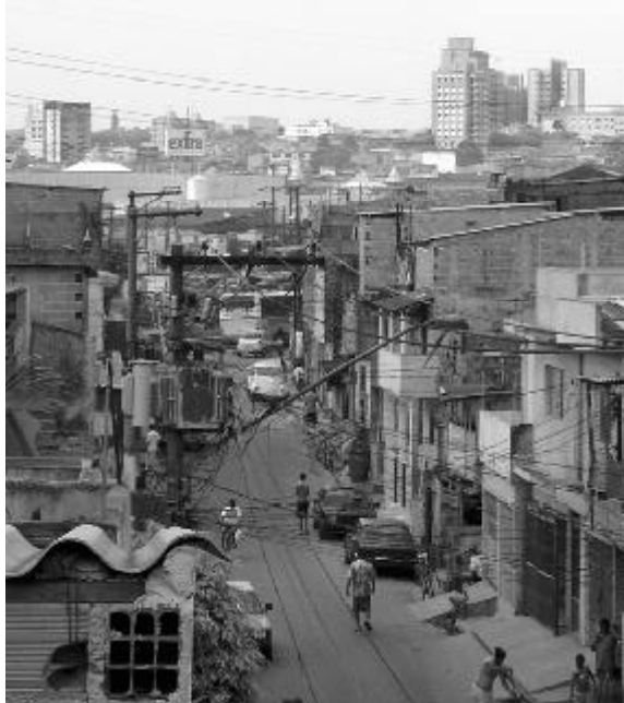
Favela Naval, 2005.

No início da década de 90, enquanto as escolas se multiplicaram e a infra-estrutura urbana se desenvolveu, a violência intensificou-se. Na nova fase dominada pelos traficantes, o papel do justiceiro deixava de fazer sentido, porque dificilmente uma pessoa sozinha seria capaz de lutar contra as novas autoridades do crime. Os pequenos traficantes dispostos a matar para se impor levaram a cidade a quebrar recordes históricos de homicídios por três anos seguidos. A violência causava pouca repercussão na comunidade. Alguns políticos costumavam negar que Diadema fosse uma cidade violenta, alegando que os altos índices de homicídio vinham da eficiência de seus hospitais públicos, que atraíam vítimas baleadas de outros lugares para morrer na cidade. Ao mesmo tempo, a polícia caiu no descaso até 1997, quando explodiu o