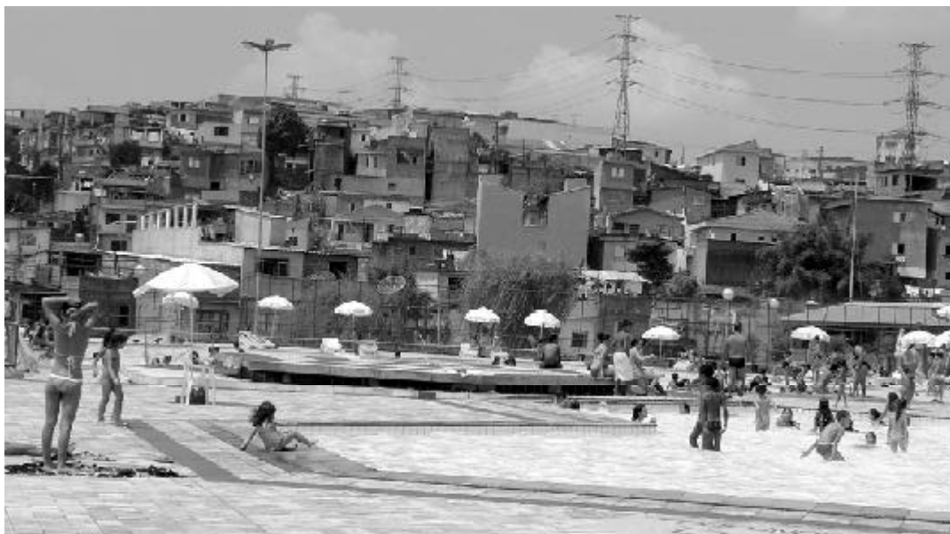
Complexo poliesportivo do SESI/Diadema, 2005.

Diadema, em conexão rápida com o Metrô de São Paulo.